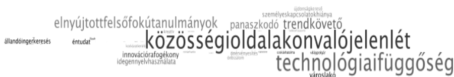
7. Ábra A válaszokból készített szófelhő (Saját szerkesztés)

7. ábra az összes kifejezést megmutatja, a 8. ábrában pedig szűrtük a tíz leggyakoribbra.