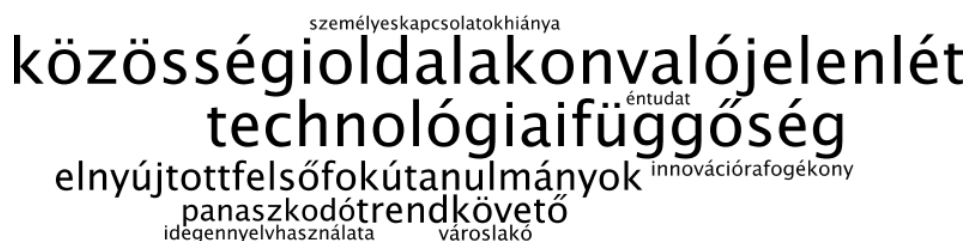
7. ábra A tíz leggyakrabban választott kifejezés szófelhője

Előzetes feltevéseink igazolódni látszanak (a szignifikáns különbségek feltérképezéséhez még további statisztikai elemzések szükségesek), vagyis az 1982-ben illetve azután született megkérdezettek saját generációjukat “technológiailag és közösségi oldalaktól” függőnek jelölik meg, akik számára az életfogytig tartó tanulás (itt elnyújtott tanulás) és a trendek, innováció követése jelentős.